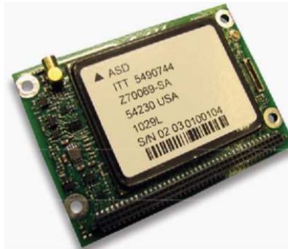
Rys. 3. Odbiornik SAASM EGR-2500™ firmy ITT Exelis

sprzętowo-programowym odbiorniki PPS mają możliwość bezpośredniej synchronizacji z kodem P(Y).