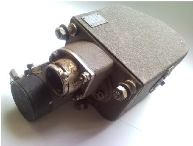
Fot. 1. Fotokarabin S-13