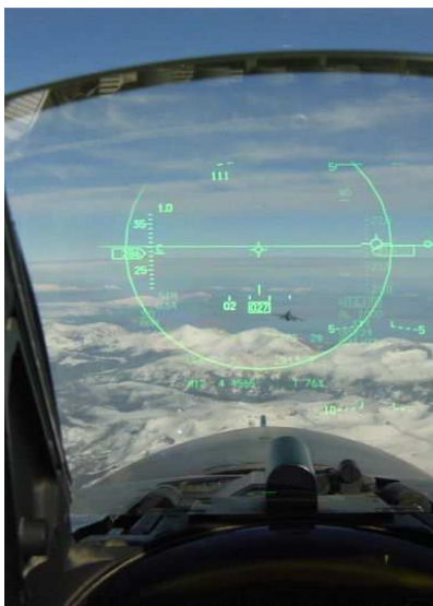
Fot. 4. Kamera DVR w kabinie samolotu F-16