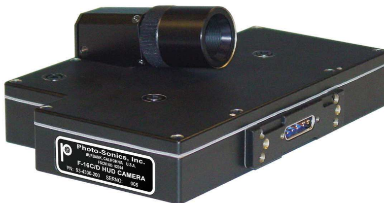
Fot. 3. Kamera DVR zastosowana na samolocie F-16

Innym, a zarazem najnowocześniejszym przykładem użycia rejestratora zastosowania bojowego jest cyfrowa kamera telewizyjna będąca na wyposażeniu samolotu F-16. Umieszczona jest za wskaźnikiem HUD i rejestruje przestrzeń przed samolotem. Informacje przedstawiane na wskaźniku są na ten obraz nakładane, a następnie zapisywane w rejestratorze.