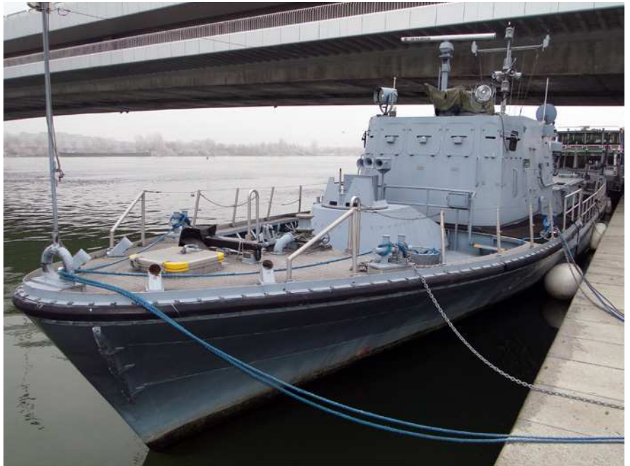
Widok na nadbudówkę Niederösterreicha . Uwagę zwracają stanowiska uzbrojenia, składane maszty oraz przeciwdziałkowe pokrywy bulajów.

Obie jednostki stały się 16 listopada 2006 roku własnością Muzeum Historii Wojskowej (Heeresgeschichtliche Muse-