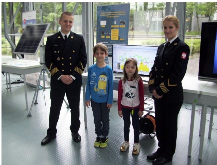
Fot. 3. Mali goście odwiedzający stanowisko stacji